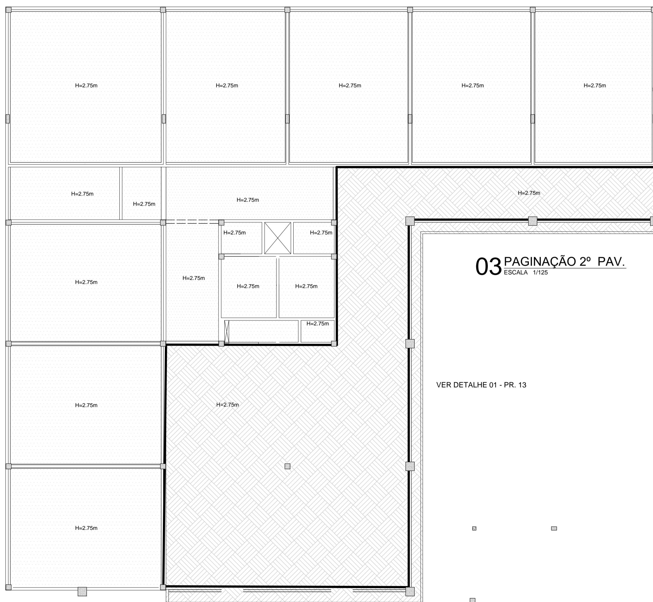
03 PAGINAÇÃO 2º PAV. ESCALA 1/125