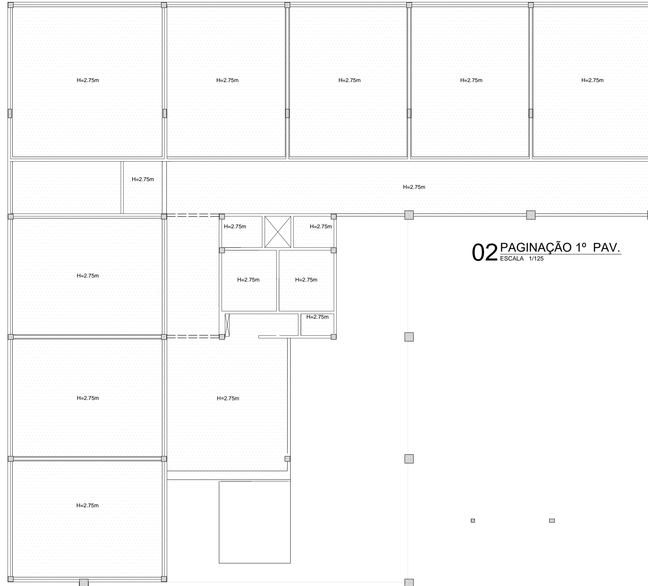
02 PAGINAÇÃO 1º PAV. ESCALA 1/125