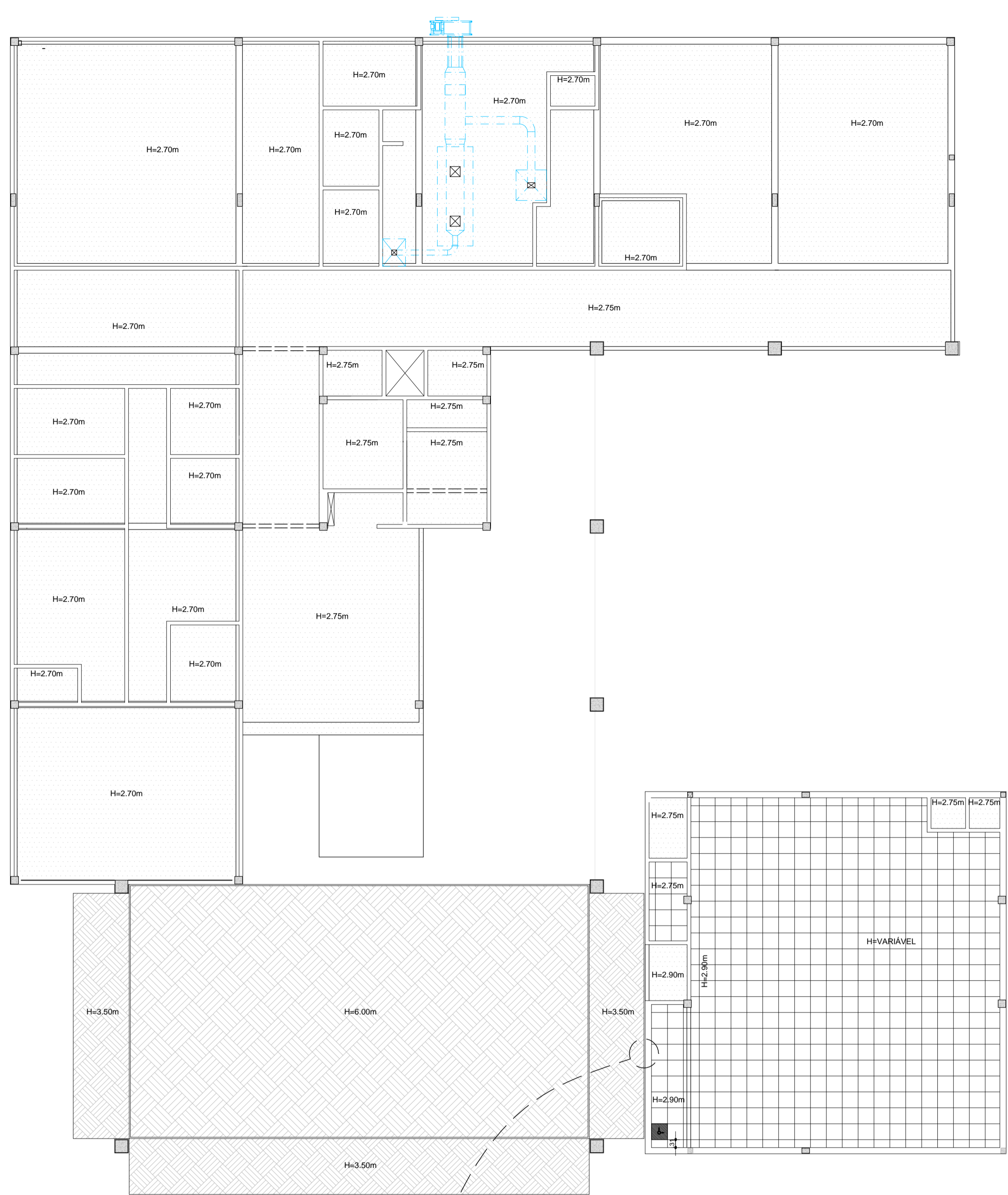
01 PAGINAÇÃO PAV. TÉRREO ESCALA 1/125